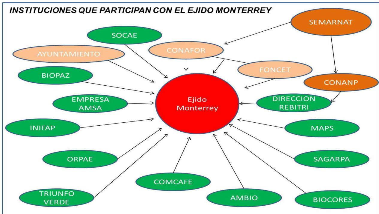
Figura 2. Instituciones participantes en el ejido, en color verde son las que tienen una participación directa, en rosa son aquellas que participan de forma directa e indirectamente con proyectos y naranja son las instituciones que participan de forma indirecta con el ejido.

Como ya se mencionó anteriormente, el Municipio es una de la instancias de gobierno que particularmente tiene presencia en el ejido, tanto políticamente como a través de alguna obra; sin embargo, también hay presencia de otras instancias gubernamentales y no gubernamentales, las cuales a través de diferentes acciones se hacen presentes en el ejido, en el siguiente esquema se muestra la participación de cada institución: